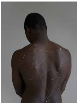
Eveline Kooijman, „Babel“, 59 x 46 cm, Fotografie mit Vektorgrafik, 2015

Seit vielen Jahren ist der Bezirk Oberpfalz auf dem Gebiet der Kunstförderung tätig und trägt hochkarätige Kunst aus der Region zusammen. Mittlerweile umfasst die „Sammlung Bezirk Oberpfalz“ mehr als 130 Werke von über 80 Künstlerinnen und Künstlern aus den verschiedensten Bereichen und vergrößert sich kontinuierlich. So wurde der Sammlungsbestand vergangenes Jahr um das Genre der Fotografie erweitert. Jährlich werden die Arbeiten in unterschiedlicher Konstellation präsentiert, so auch zu Jahresbeginn 2017 mit den Neuerwerbungen von Alois Achatz (Heliogravüre), Rudolf Koller (Plastik und Zeichnung), Eveline Kooijman (Fotografie) und Hans Lankes (Messerschnitt).