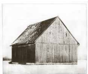
Alois Achatz, „Scheune“, 48 x 57 cm, Heliogravüre, 2005