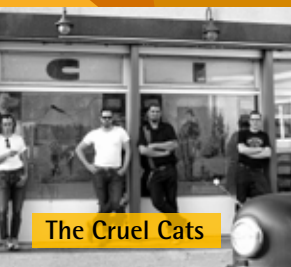
The Cruel Cats

Bühnenprogramm organisiert von Jugendtreff und Jugendbeirat