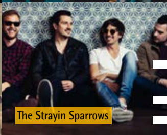
The Strayin Sparrows