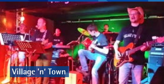
Village 'n' Town