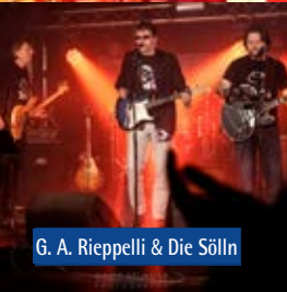
G. A. Rieppelli & Die Sölln