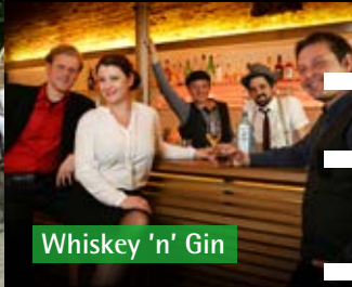
Whiskey 'n' Gin