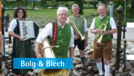
Bolg & Blech