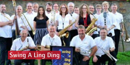
Swing A Ling Ding