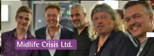
Midlife Crisis Ltd.